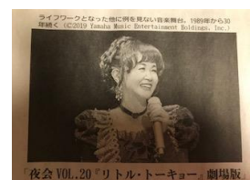
夜会 VOL.20 「リトル・トーキョー」劇場版

なかなか飲食店には足を踏み入れられないところです。中島みゆきの上記を観るために映画館に足を運びました。渡辺真知子の声量に魅了されました。二人とも60代後半かと思いますが、すごいパワーです。「(人と人は)ズれているから気になる。合わないから惹かれる」という歌詞がありました。煩わしいけどそれが人間の生活・人生ですね。