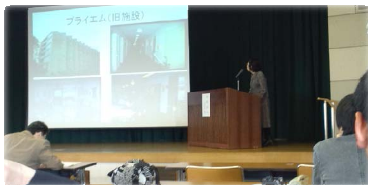
大分大学教育福祉科学講座「地域居住困難を支えるために」の様子