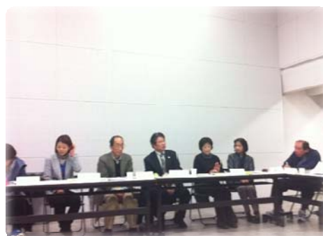
コミュニティハウス説明会の様子